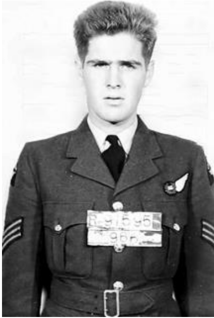
Datum onbekend.