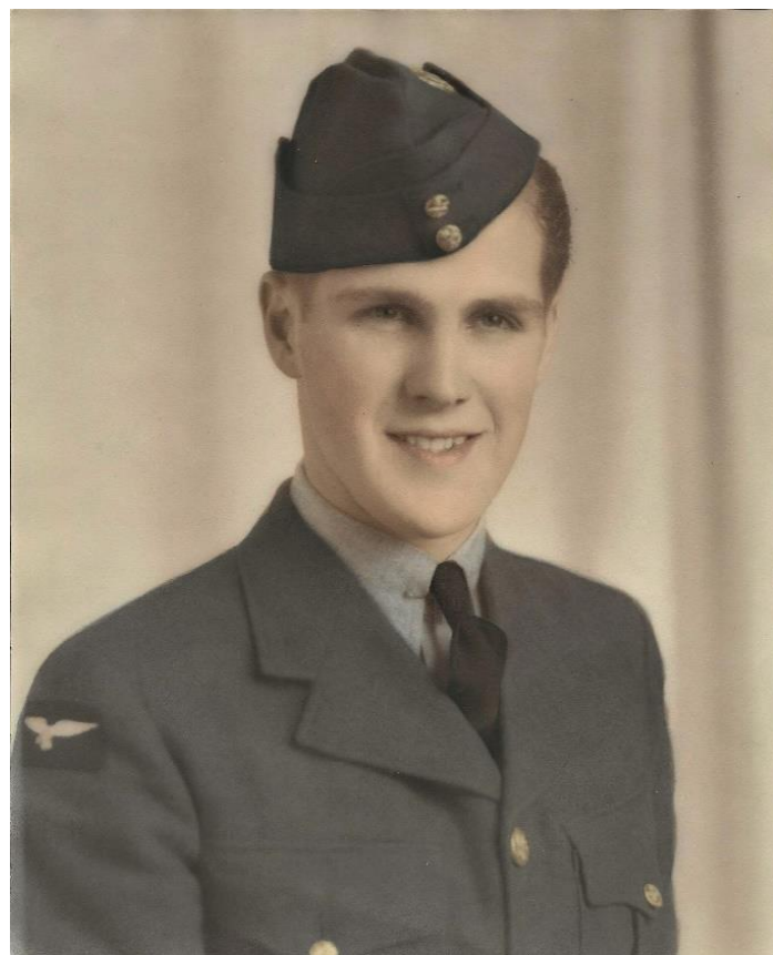
Datum onbekend.

De locatie waar het toestel neergestort is: Wanroij, Nederland. Het Planehunters Recovery Team heeft de locatie onderzocht en delen van het toestel zijn opgegraven.