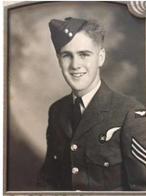
Datum onbekend.